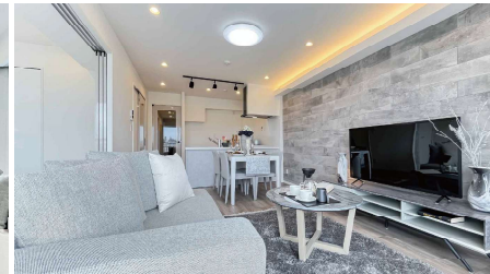
※写真は当社施工例となります。